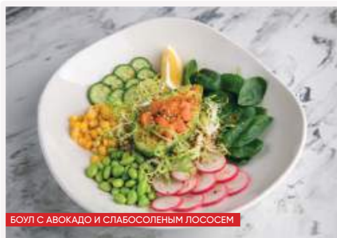
БОУЛ С АВОКАДО И СЛАБОСОЛЕННЫМ ЛОСОСЕМ

СЭНДВИЧ С ЛОСОСЕМ 150г 280 лист салата, филе лосося, огурец, соус филадельфия [кк 332,6 / б 22,2 / ж 11,4 / у 31]