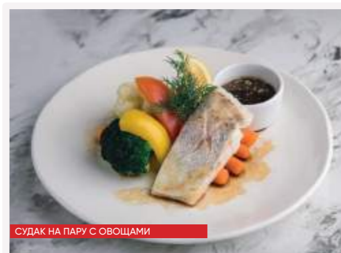
СУДАК НА ПАРУ С ОВОЩАМИ

СУДАК НА ПАРУ С ОВОЩАМИ 100/250г 680 судак, брокколи, капуста цветная, цуккини, болгарский перец, мини морковь, лимон, укроп, соус тартар [кк 234,4 / б 28,1 / ж 4,8 / у 18,6]