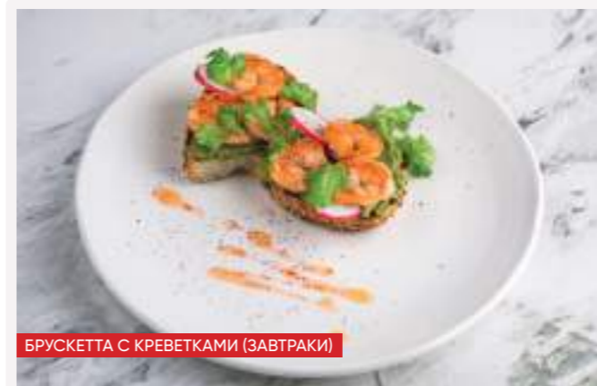
БРУСКЕТТА С КРЕВЕТКАМИ (ЗАВТРАКИ)

ГРАНОЛА С БАНАНОМ И КЛУБНИКОЙ 190г 250 гранола, клубника, банан, классический йогурт, семена чиа [кк 159,2 / б 8,7 / ж 14,4 / у 14,4]