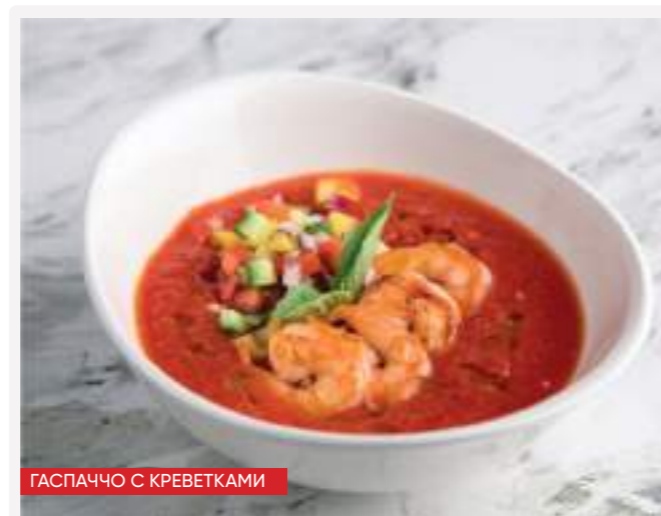
ГАСПАЧЧО С КРЕВЕТКАМИ

NEW ОКРОШКА НА КВАСЕ С ТЕЛЯТИНОЙ 300г 350 квас, телятина, картофель, огурец, редис, яйцо перепелиное, укроп, петрушка [кк 124,3 / б 10,3 / ж 1,9 / у 14,4]