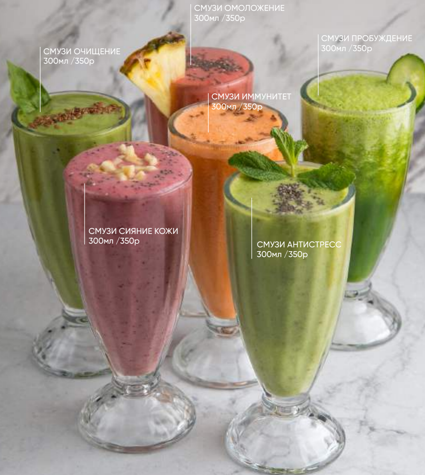
СМУЗИ ОЧИЩЕНИЕ 300мл / 350р