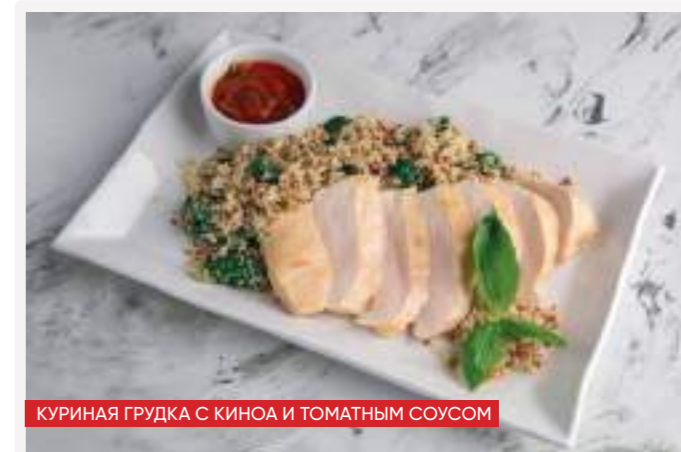
КУРИНАЯ ГРУДКА С КИНОА И ТОМАТНЫМ СОУСОМ

КИНОА СО ШПИНАТОМ 150г 330 киноа, шпинат к 230 б 7 ж 3 у 41