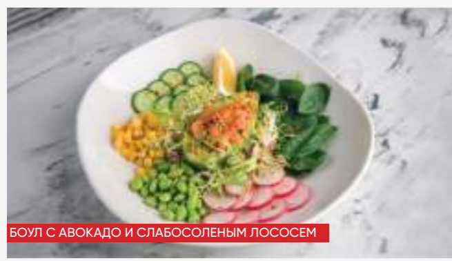
БОУЛ С АВОКАДО И СЛАБОСОЛЕННЫМ ЛОСОСЕМ