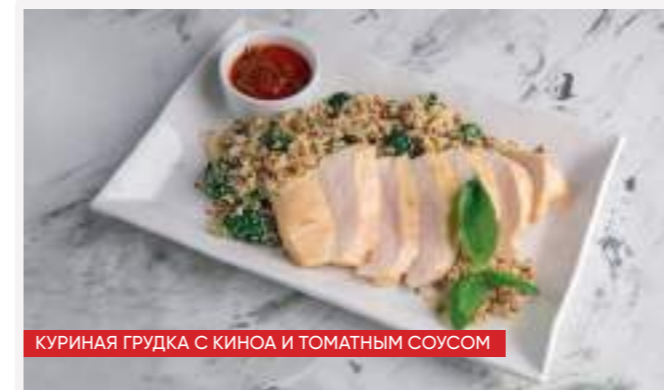
КУРИНАЯ ГРУДКА С КИНОА И ТОМАТНЫМ СОУСОМ