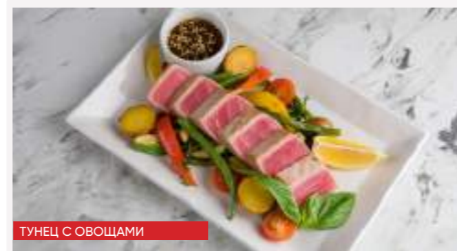
ТУНЕЦ С ОВОЩАМИ